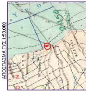
ΑΠΟΣΠΑΣΜΑ ΓΥΣ 1:50.000