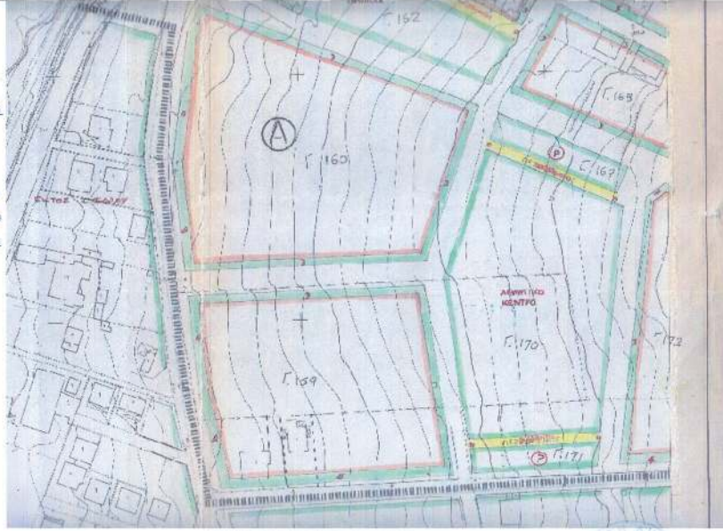
ΑΠΟΤΥΠΩΜΑ ΕΤΥ/ΜΕΝΟΤ ΡΥΜ/ΚΟΤ ΚΥΜΑΚΑ 1:1000

Ρ.Γ. Κ.Ο.Γ. με Στοιχεία Γνώμης Μακρο, ΝΟΤΗΤΑΣ ΑΝΑΤΕΙΟΤ 2024 ΠΡΟΤΕΙΝΟΜΕΝΟΙ ΟΡΟΙ ΔΟΜΗΣΗΣ Είναι σύμφωνα με την Πράξη 27/12/22 των αρμοδίων του Σχεδίου της Αθήνας και είναι οι εξής: - Συντελεστής Δόμησης: 0,8 - Μέγιστο ποσοστό κάλυψης: 40% - Μέγιστο επιτρεπόμενο ύψος: 8,5μ Απαγορεύεται η κατασκευή κτιρίων με κλίση μεγαλύτερη από 40% και η κατασκευή κτιρίων με κλίση μεγαλύτερη από 40%. Ο ΑΥ ΠΡΟΣΤΑΜΕΝΟΣ ΤΗΣ ΑΔΕΙΑΣ 21.04.2023 11:04 Επίσημο Γεωγραφικό ΕΛΛΗΝΙΚΗ ΔΗΜΟΚΡΑΤΙΑ ΥΠΟΥΡΓΕΙΟ ΠΕΡΙΒΑΛΛΟΝΤΟΣ ΚΑΙ ΕΝΕΡΓΕΙΑΣ ΓΕΝΙΚΗ ΔΙΕΥΘΥΝΣΗ ΠΡΟΣΤΑΣΙΑΣ ΤΗΣ ΑΔΕΙΑΣ ΔΙΟΙΚΗΤΙΚΗ ΥΠΗΡΕΣΙΑ ΤΕΧΝΙΚΩΝ ΕΡΓΩΝ