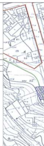
ΑΠΟΣΠΑΣΜΑ F (Εγκριθέντι)