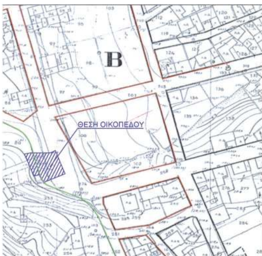
ΣΠΑΞΜΑ ΡΥΜΟΤΟΜΙΚΟΥ ΣΧΕΔΙΟΥ ΠΙΝΑΚΙΔΑ (3) ΚΛΙΜΑΚΑ 1:1000 (Εγκριθέντος δια του Β.Δ./27-01-1953 - ΦΕΚ 19/τ.Α/31-01-1953)