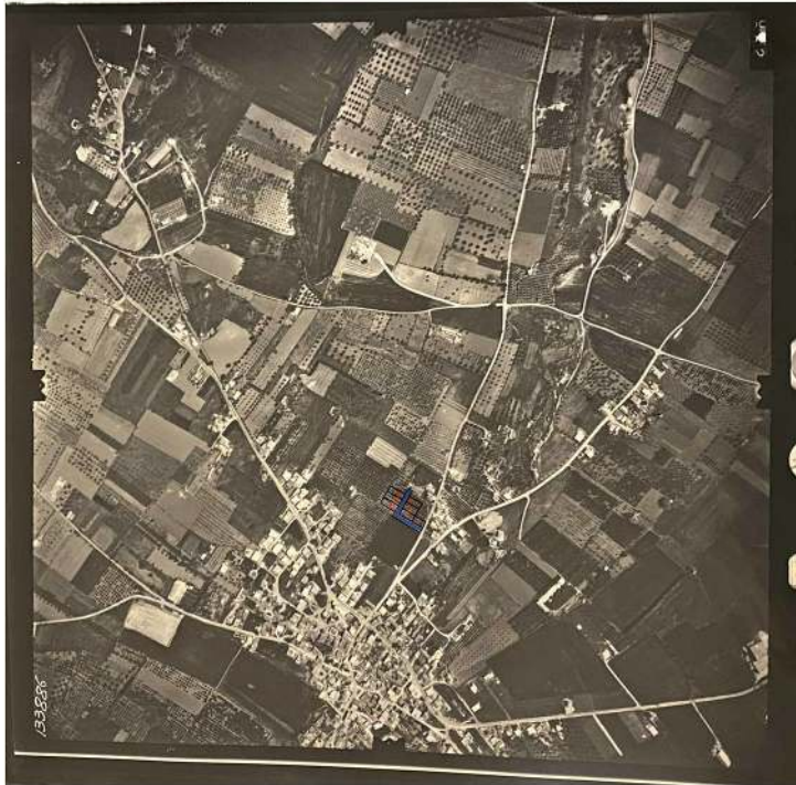
Αεροφωτογραφία 133886 , 09/04/1981 από το Ελληνικό Κτηματολόγιο κλίμ.1:5000