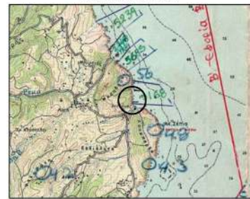
ΑΠΟΣΠΑΣΜΑ ΓΥΣ 1:50.000

ΕΘΝΙΚΟ ΤΥΠΟΓΡΑΦΕΙΟ Για τεχνικούς λόγους στο σχεδιάγραμμα, από το ηλεκτρονικό αρχείο, έγινε σμίκρυνση κατά ποσοστό 40%