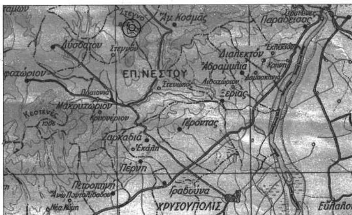
ΧΑΡΤΗΣ ΠΡΟΣΑΝΑΤΟΛΙΣΜΟΥ ΚΛΙΜΑΚΑ 1:200000 Θέση επέμβασης

Το παρόν αποτελεί αναπόσπαστο μέρος της υπ' αριθ. 248402/18-5-2023 απόφασης του Ε.Ε.Δ.Π. Μακεδονίας-Θράκης