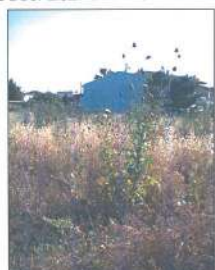
ΦΩΤΟ 3 ΝΟΤΙΟΔΥΤΙΚΗ ΑΠΟΨΗ ΟΙΚΟΠΕΔΟΥ