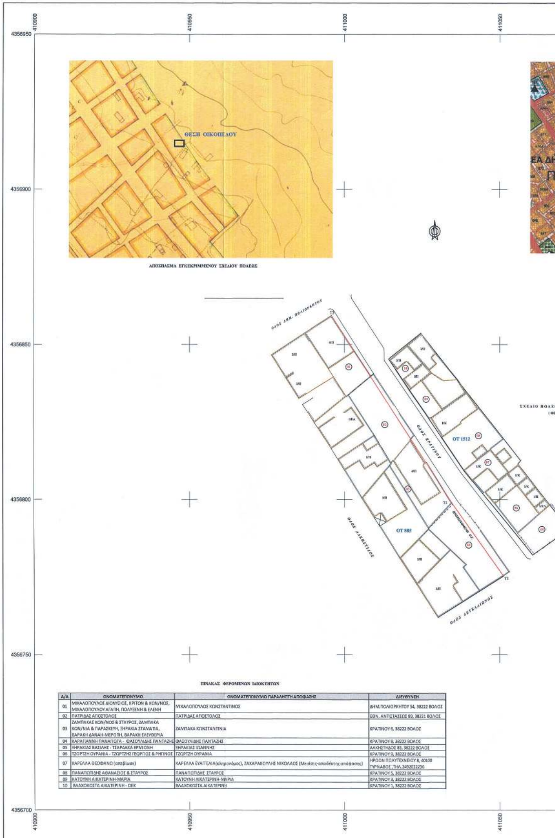
ΠΙΝΑΚΑΣ ΦΕΡΟΜΕΝΩΝ ΙΔΙΟΚΤΗΤΩΝ

ΕΘΝΙΚΟ ΤΥΠΟΓΡΑΦΕΙΟ Για τεχνικούς λόγους στο σχεδιάγραμμα, από το ηλεκτρονικό αρχείο, έγινε σμίκρυνση κατά ποσοστό 42%