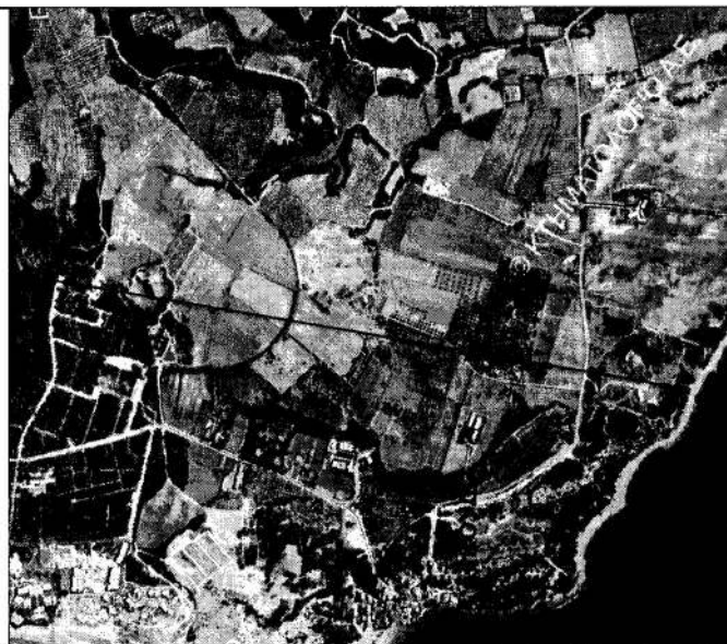
ΑΠΟΣΠΑΣΜΑ ΧΑΡΤΗ ΚΤΗΜΑΤΟΛΟΓΙΟΥ ΚΛΙΜΑΚΑΣ 1:20.000 ΘΕΣΗ ΚΑΜΕΝΗΣ ΕΚΤΑΣΗΣ

Δημόσιου Δάσους στη θέση "ΑΡΚΟΥΔΙ" περιφέρειας Τ.Κ. Γλύφας Δ.Ε.Βαρθολομίου του Δήμου Πηνειού Π.Ε.Ηλείας, συνολικού εμβαδού 0,503 τ.μ.με στοιχεία (1.2.3.....10.11.12.1) που κάρηκε στις 02-06-2023 όπως διαπιστώθηκε στις 12/06/2023. ΚΛΙΜΑΚΑ 1:500