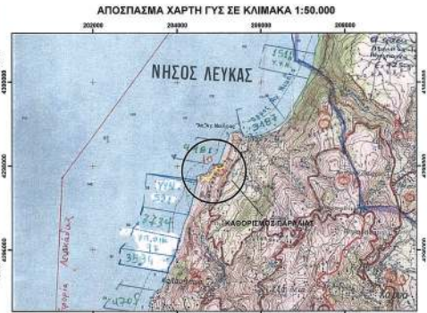
ΣΥΝΤΕΤΑΓΜΕΝΕΣ ΚΟΡΥΦΕΣ ΝΕΑΣ ΟΡΓΑΝΩΣΗΣ ΠΑΡΑΛΙΑΣ (ΕΓΣΑ '87)